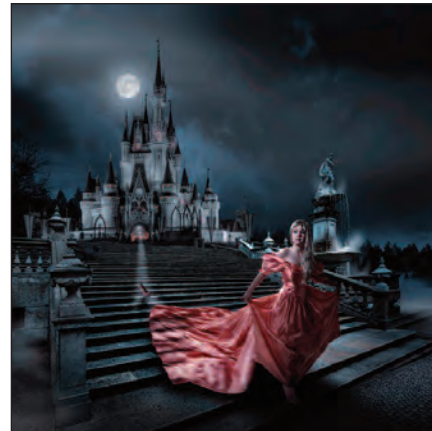
1. Rang 2013 Markus Wolf. Wof Fotografie, Olten