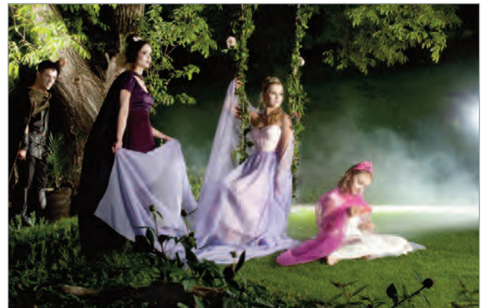
3. Rang 2013 Gaby Tschan, Fotostudio Gaby Müller, Sargans