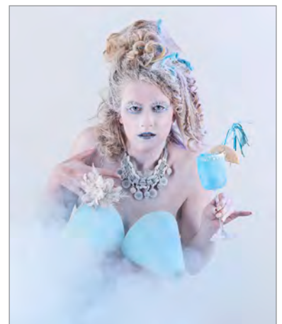
3. Rang Rolf Sutter FOTOGRAFICA [urban] Fotostudio Huttwil