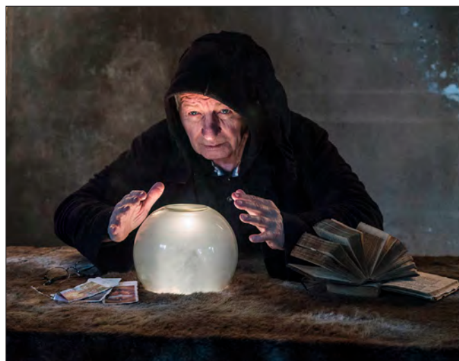
Der Wahrsager prophezeit ein interessantes und spannendes CAP-Vereinsjahr.