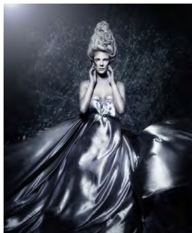
2. Rang Karin Heidmeier Fotostudio Neuburg (D)